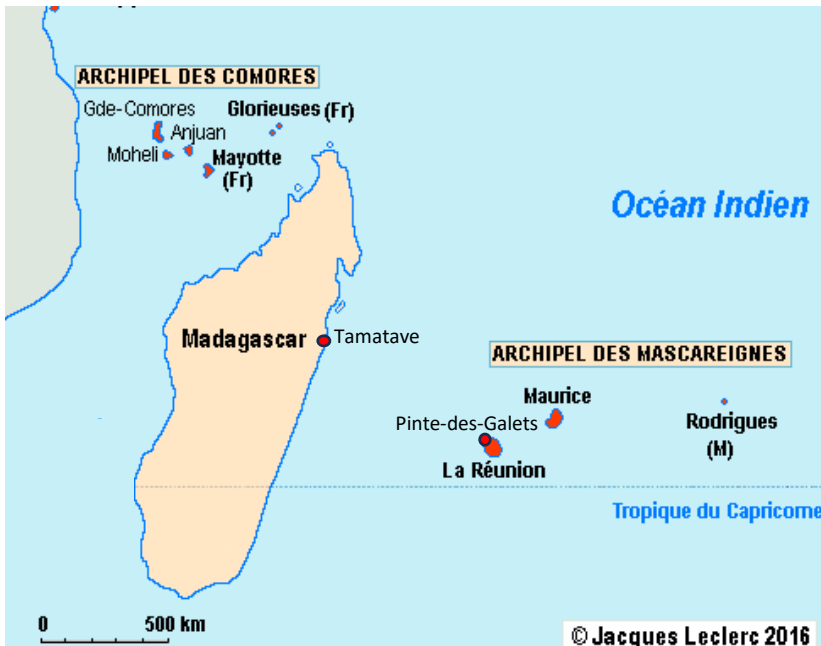
Document 2 : Carte de l'Océan Indien

Seuls les hommes âgés de 21 ans à 51 ans sont réquisitionnés au front tandis que les femmes volontaires deviennent infirmières.